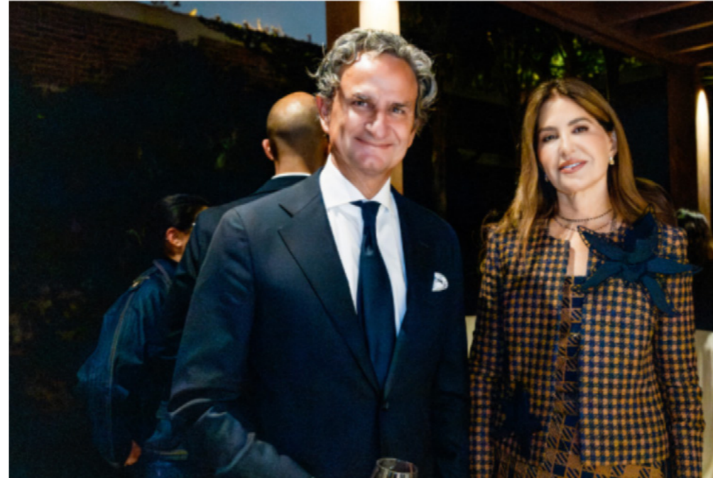
Cóctel de Help Peru en Lima junto a socios, aliados y amigos.