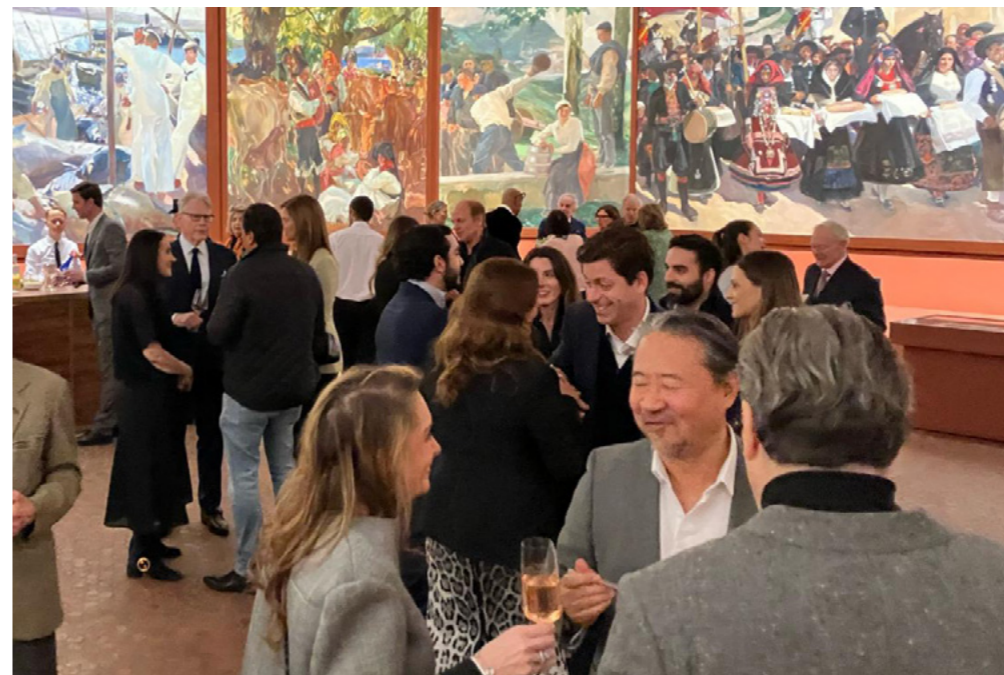
Inauguración de The Colorful World of Pancho Fierro en el Hispanic Society Museum & Library de Nueva York.