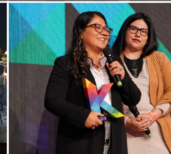
Ceremonia del Gran Premio Kunan 2025.