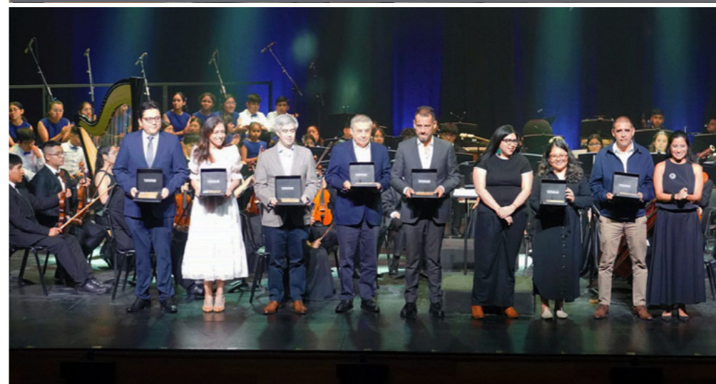
Reconocimiento de Help Peru en concierto de Sinfonía por el Perú.