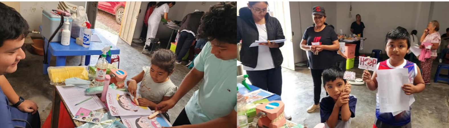
Campaña de salud comunitaria en Huanchaco, Trujillo.

La salud infantil influye directamente en la capacidad de niños y niñas para aprender y desarrollarse plenamente. Complementamos nuestras iniciativas educativas con programas de cuidado preventivo, desarrollo en primera infancia, nutrición, prevención del dengue y manejo de residuos, especialmente en comunidades con acceso limitado a servicios básicos de salud.