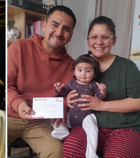
Postales escritas por beneficiarios de los programas.